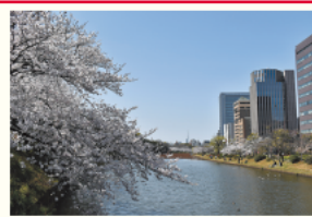
舞鶴公園の桜(昨年)

区の人口 207,549人(前月比171人増) (男93,398人 女114,151人) 世帯数 129,293世帯(前月比27世帯増) (令和4年2月1日現在推計)