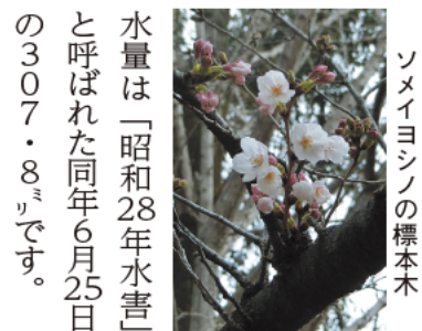
ソメイヨシノの標本木

桜の開花・満開も発表 同気象台の敷地内にはソメイヨシノ(桜)、ウメ、アジサイ、イチヨウ、カエデ等が植えられ、開花、満開、紅葉等で季節の移り変わりを判断する「生物季節観測」を行っています。中でも多くの人々の注目を集めるのはソメイヨシノです。5輪咲いたら開花、8割咲いたら満開と発表しています。福岡は開花が全国的に早いため、多くの報道機関が取材に訪れます。