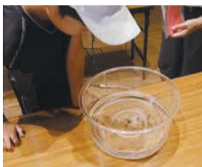
自然について楽しく学びます

開 1月30日(土)午後2時～4時(1時半より受け付け) 所 西市民センター視聴覚室 定 抽選で30人 料 無料 申 問はがき、ファクスまたはメールに、イベント名、住所、氏名(ふりがな)、年齢、電話番号を書いて、1月18日(月)必着でまるごと博物館推進会事務局(〒819-8501住所不要、区企画振興課内 ☎895-7032 ☎885-0467 ✉shinko.event24@city.fukuoka.lg.jp)へ。抽選結果は1月25日(月)までに発送。