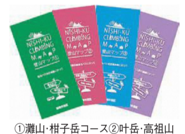
①灘山・柑子岳コース②叶岳・高祖山コース③飯盛山コース④毘沙門山コース

絶景ポイントや登山のモデルルート、公共交通機関を利用したアクセス情報などを分かりやすく載せています。