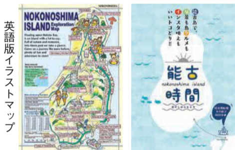
英語版イラストマップ

1年を通して季節の花々が咲き誇る「このしまアイランドパーク」や「万葉歌碑」など、豊かな自然や歴史について紹介しています。写真。能古島は、姪浜渡船場から約10分で行ける、