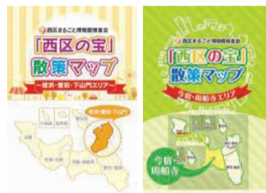
たくさんの西区の宝を掲載しています

家族でのお出掛けに適した公園や、歴史が感じられる神社や史跡、区内で行われる祭りや行事などを紹介しています。