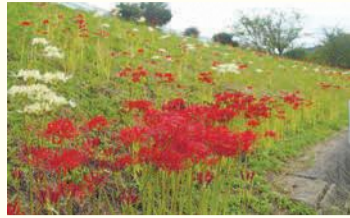
今宿上ノ原の彼岸花