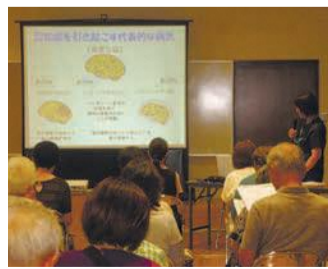
認知症について詳しく学びます

公式インスタグラムで、西区の魅力スポットを紹介しています。スマートフォンなどで、海に溶けるような夕陽や、咲き誇る花々、いこしえを感じさせる寺社、隠れスポットなど、小旅行を体験してみませんか。