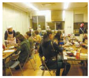
子どもから大人まで幅広く参加しています