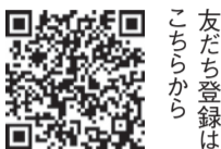
友だち登録は こちらから

福岡市LINE公式アカウントの「防犯・ 交通安全」のカテゴリーで、福岡県警の 防犯メール「ふっけい安心メール」で配 信される緊急事案をお知らせしていま す。二セ電話詐欺事案、交通安全情報、 不審電話・不審者情報などがトーク画面 に配信されます。