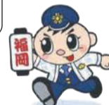
県警マスコット ふっけい君