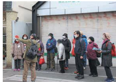
説明に聞き入る参加者

「承天寺一山報賽式」を見学した後、地区内に点在する史跡や神社などを巡りました。Ⅱ下図参照。九大箱崎キャンパス跡地の開発が進む箱崎地区は、旧市街地としても知られ、貴重な建造物が数多く残っています。ガイドは、同地区には町家が市内で一番多く残っている(約50軒)こと、「御