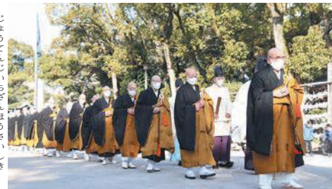
箱崎宮の「承天寺一山報賽式」

さんぽ会は、年に10回程度、区内の史跡を巡る「町歩き」を開催し、その際のボランティアガイドを行っています。1月11日に開催された箱崎地区の町歩きには、抽選で選ばれた25人が参加しました。この日は、箱崎宮で行われた神事