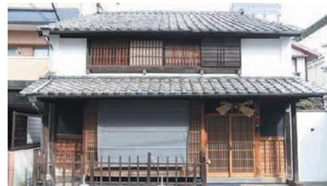
箱崎の代表的な町家「藤野家住宅」(非公開)