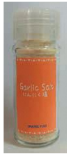
リタリコワークス天神

製品が製造されています。人気の高い「にんにく塩」「左下写真」や「ジンジャーシユガー」は材料の皮むきや薄切りなど多くの工程があり、全ての利用者が関わっています。中でも「にんにく塩」は、市が「ユニバーサル都市・福岡」の実現に向けて取り組む「ときめきプロジェクト」の一環で、障がい者施設の商品の中から魅力的な物を表彰する「ときめきセレクション」でニューカム賞を受賞。