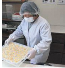
心を込めて商品をつくります

生活介護事業所の「スマップレプラス」(中央区伊崎)は、障がいのある人たちに、食事などの支援や商品づくりなどの機会を提供し、生活に必要な力を向上してもらうための援助を行っています。