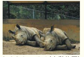
ミナミシロサイ(市動物園)

区の人口 204,588人 (前月比7人増) (男 91,484人 女 113,104人) 世帯数 126,621世帯 (前月比97世帯増) (令和2年9月1日現在推計)