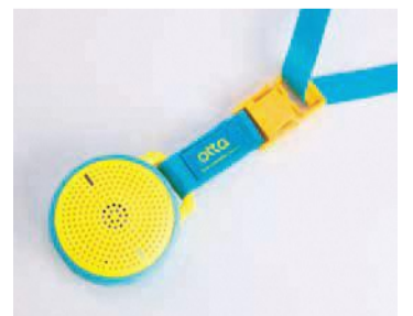
つながる安心感を子どもたちに