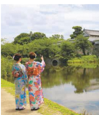
福岡城跡で着物体験

イベント当日、福岡城「三の丸スクエア」で乗馬体験を実施するほか、「福岡城 舞遊の館」で、着物のレンタル時間を延長して着付けを行います(要予約)。