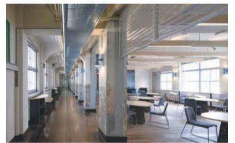
福岡中央区大名二丁目(旧大名小学校) ☎080-8375-8609 🌐https://growth-next.com/