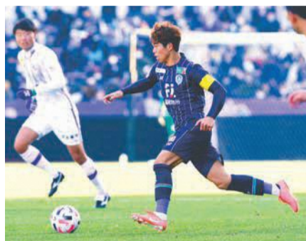
最終戦の前寛之選手。ベスト電器スタジアムでJ2首位の徳島ヴォルティスに1-0で勝利

今年は、勝ち点50以上、リーグ戦10位以内を目指します。これまで、5年おきに昇格しては翌年J2降格を繰り返してきました。このまましっかりJ1に定着したいと思います。我々の強みである堅い守りをさらに強化し、不足していた得点力を期待の新戦力で補って、アグレッシブに戦います。