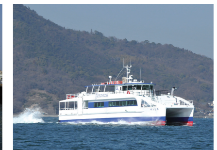
■ゆうなみ(共通予備船) Yunami (substitute vessel in common use)