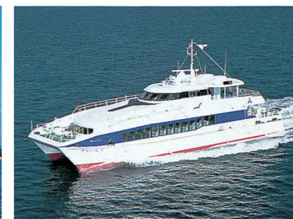
■きんいん1(志賀島航路) Kinin1 (Shikanoshima Route)