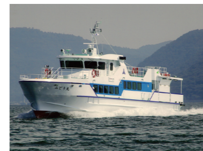
■みどり丸(玄界島航路) Midori Maru (Genkaijima Route)