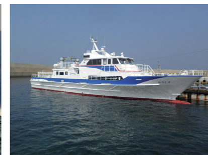
■ニューおろしま(小呂島航路) New Oroshima (Oronoshima Route)