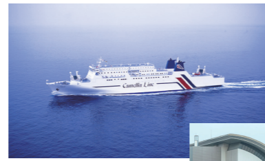
■左—ニューかめりあ ■下—クイーンビートル

The Port of Hakata is the gateway to the sea, with 580,000 people passing through it annually. In particular, Hakata Wharf and Chuo Wharf are located in the heart of the city and serve as passenger transportation hubs.