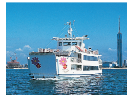
■フラワーのこ(能古航路) Flower Noko (Nokonoshima Route)

The Hakata Bay Sightseeing Route is a chartered ferry service that circles Hakata Bay. The route is widely used for tours and events, and allows passengers to enjoy the scenery of the city and Hakata Bay from the ship.