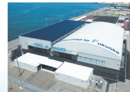
■中央ふ頭クルーズセンター