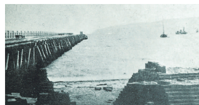
■明治23年に完成した博多港初の木製さん橋