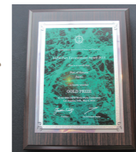
■「港湾環境賞」金賞の盾