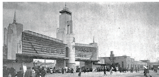
■博多築港記念博覧会(昭和11年)の会場正門のにぎわい