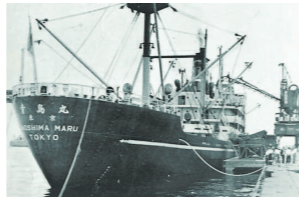
■中央ふ頭横さん橋に停泊中の輸送船(昭和31年)