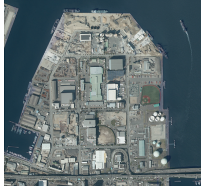
■係留施設 Mooring Facility

Construction materials and LPG (liquefied petroleum gas) are handled at this facility.