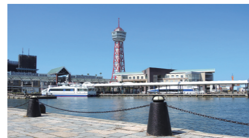
■博多ポートタワーとベイサイドプレイス博多 Hakata Port Tower and Bayside Place HAKATA

Hakata wharf has been developed as a vibrant exchange hub including Hakata Port Tower, Hakata Port Bayside Museum, and Bayside Place HAKATA with a passenger terminal and restaurants.