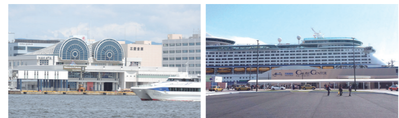
■博多港国際ターミナル Hakata Port International Terminal

Chuo Wharf functions as an advanced distribution hub with sophisticated warehouses and other facilities. MICE(Meetings, Incentives, Conferences and Exhibitions)-related facilities such as Fukuoka International Congress Center, exhibition centers, and halls are also concentrated, and many international conferences and other events are held here. Hakata Port International Terminal and Cruise Center are crowded with passengers for cruise ships and passenger ships to Busan.