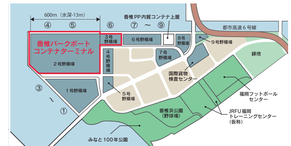
■香椎パークポート