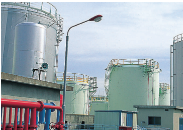
荒津地区 ARATSU AREA