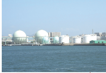
東浜ふ頭 HIGASHIHAMA WHARF