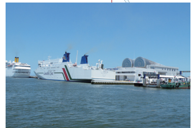
中央ふ頭 CHUO WHARF