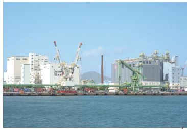
箱崎ふ頭 HAKOZAKI WHARF