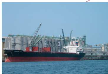
須崎ふ頭 SUZAKI WHARF