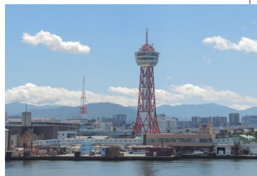
博多ふ頭 HAKATA WHARF