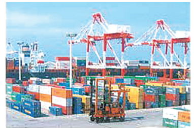
香椎パークポート KASHII PARK PORT