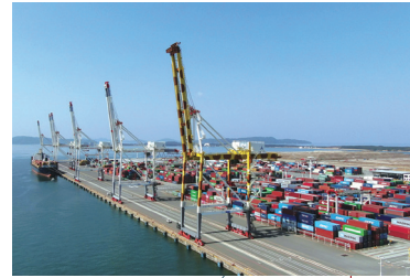
アイランドシティ ISLAND CITY