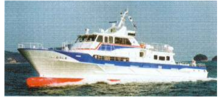
【오로노시마 항로 : 뉴 오로시마】