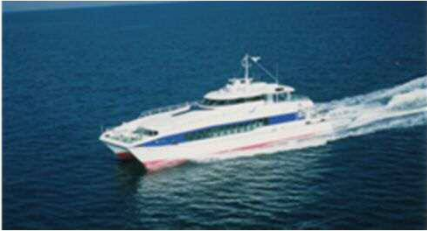
【시카노시마 항로 : 긴인 1】