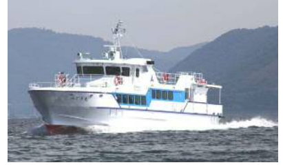
【겐카이시마 항로 : 미도리 원】