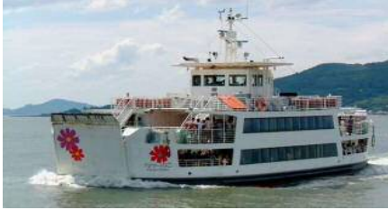
【노코 항로 : 플라워 노코】