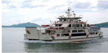
【노코 항로 : 레인보우 노코】