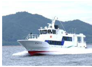
【시카노시마 항로 : 긴인】