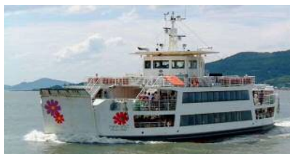
【能古航路:フラワーのこ】