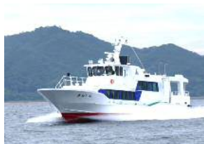
【志賀島航路:きんいん】