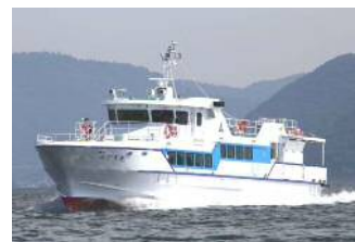
【玄界島航路:みどり丸】