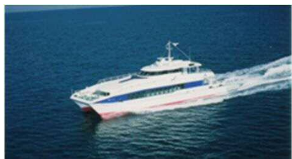
【志賀島航路:きんいん1】