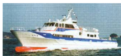
【小呂島航路:ニューおろしま】