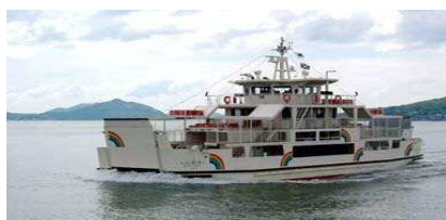
【能古航路:レインボーのこ】