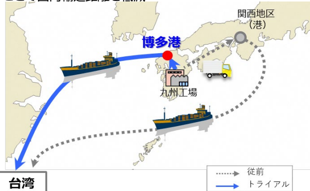
輸送コストの比較 (従前を100とする)