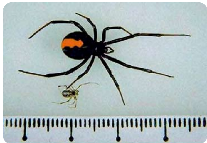
セアカゴケグモ 雌(大) 雄(小) 雌は体長(頭から尻まで)約1cm、全体に黒く、背に赤色の帯状に模様があります。