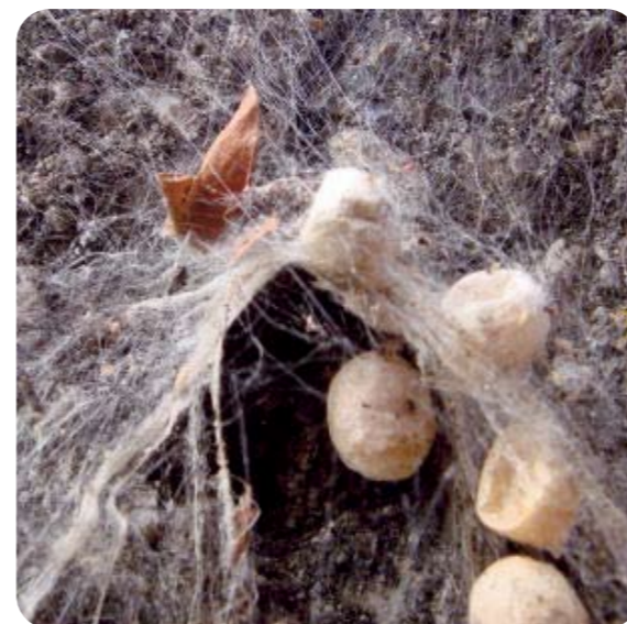
セアカゴケグモの卵のう

※平成21年11月末現在、セアカゴケグモ、ハイイロゴケグモの福岡市内で確認されている生息地は、東区及び博多区の一部のみです。