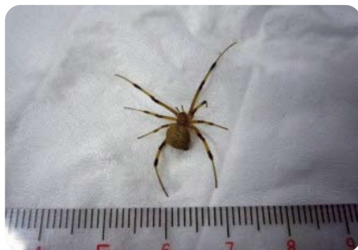
ハイイロゴケグモ 雌 体長は約1cm、背面の色は、灰色、黒色など様々で、水滴様の斑紋があります。

セアカゴケグモやハイイロゴケグモは毒を持っていますが、攻撃性もなく、おとなしいクモです。素手で触らない限り咬まれることはありません。咬まれる例のほとんどは、雌によるものです。