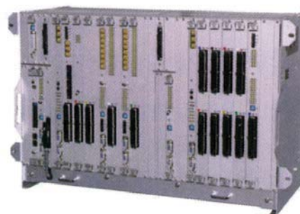
③ 車両情報制御装置