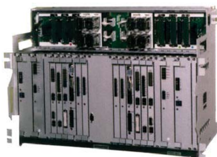
② 自動列車運転装置