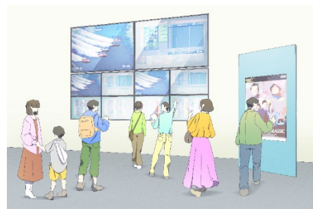
複数画面で他場のレース情報を観覧するイメージ

また、ギャンブル等依存症への対策を行い、健全な場としての運営を継続していきます。