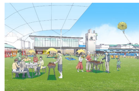
非開催日にイベントで活用するイメージ

非開催日における市民向けの様々なイベントの実施や地域活動等への有効活用を通じて、市民に身近な施設を目指します。