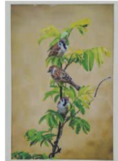
写真部門・最優秀賞 六山茂樹「雀の自粛」