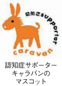
認知症サポーターキャラバンのマスコット

認知症の人との接し方などを学びます。 ①認知症サポーター養成講座 期1月27日(水)午前10時～11時半所あいれふ10階講堂(舞鶴二丁目)所市内に住む人無料抽選で50人無料 ②認知症サポーター・ステッ プアップ講座 期2月3日(水)、10日(水)の午前10時～正午所あいれふ7階第3研修室所認知症サポーター養成講座を修了し、本講座を受講したことがない人で、2回とも出席できる人無料抽選で15人無料※①②共通甲1月5日(火)午前9時から電話で区地域保健福祉課(☎718-1110 734-1690)へ。