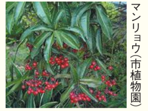
マンリョウ(市植物園)

区の人口 204,588人 (前月比7人増) (男 91,484人 女 113,104人) 世帯数 126,621世帯 (前月比 97世帯増) (令和2年9月1日現在推計)