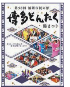
令和元年作製のパンフレット

5月に開催予定の「博多どんたく港まつり」で、どんたく事業を紹介するパンフレットに広告を掲載します。料協賛金1枠(縦40ミ×横60ミ)4,000円(複数枠の場合、枠数に応じて減額)