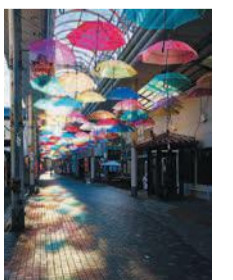
区アンブレラスカイのイメージ

演舞台の上空にさまざまな色のビニール傘を敷き詰め、傘の持ち手に協賛者の名前を書いた短冊をぶら下げます。料協賛金1本4,000円※①②共通甲1月29日(金)までに区企画振興課「市民の祭り運営委員会事務局」(☎718-1055 714-2141)