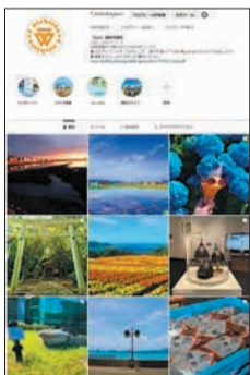
魅力あふれる写真を多数紹介

区公式Instagram写真展を右記の通り開催します。区内の美しい風景や、お気に入りの一枚、奇跡の瞬間、何気ない日常など、魅力的な写真をピックアップして展示します。