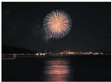
今年度 今宿地区納涼花火大会