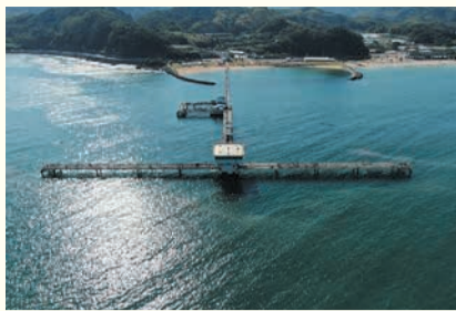
上空から見た「海づり公園」