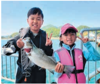
釣り上げた見事なヒラメスズキ

年間を通して、その時に旬を迎えるさまざまな魚が釣れます。夏の時期は、アジ、スズキ、チヌ、メイト、クロ、バリなどが釣れます。併設された海洋釣り堀では、豪快なマダイ釣りも体験できます(釣り上げたマダイは別途有料)。