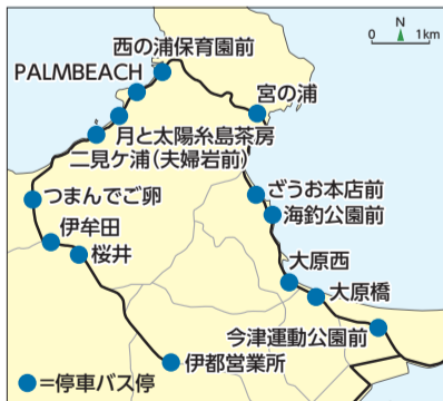
「海づり公園」をはじめ、観光スポットを周遊できます。

博多バスターミナルから天神を経由し、海づり公園や二見ヶ浦などに停まる高速バス「ウエストコーストライナー」をご存じですか。博多~二見ヶ浦間の運賃は、市地下鉄とJR、路線バスを乗り継いだ場合より110円安い、片道1,150円です。また、スマホアプリ「マイルート」で「糸島半島1 day(ワンデー)フリー