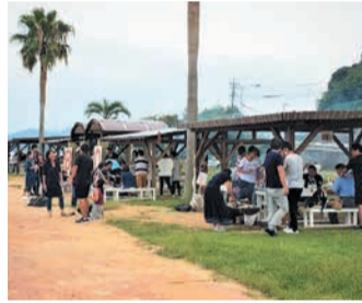
最高のロケーションで自分が釣った魚を味わえます

敷地内でバーベキューやデイキャンプが楽しめます(要予約、有料)。手ぶらで可能な予約コースもあります。自分が釣った魚以外の食材は事前予約で購入できるほか、持ち込みも可能です。※釣りをしなくても利用できます。