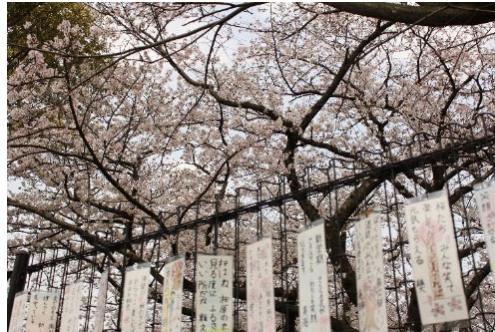
「桜原桜公園」内に掲げられた短歌