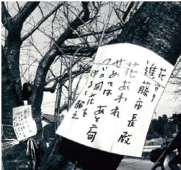
桜の木に結ばれた短歌

昭和 59(1984)年 3 月、桜原地区に植えられていた樹齢 50 年のソメイヨシノ 9 本が、道路の拡幅工事により伐採されることになりました。1 本が伐採された翌日の未明に一人の住民が桜の木に短歌を結び、当時の市長に「最後の花を咲かせて」と嘆願しました。それから共感の歌が桜に次々と寄せられ、その中に市長からの返歌もありました。その後、工事は一部変更され、残りの 8 本の桜は伐採を免れました。今では、一帯は桜原桜公園として整備され、地域の人々の憩いの場となっています。