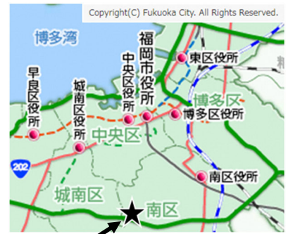
桜原桜公園の位置

問 28 あなたは「桜原桜」と「桜原桜にまつわるエピソード」を知っていましたか。あてはまるものを 1 つだけ 選び、番号に○をつけてください。(N=547)