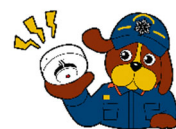
福岡市消防局マスコットキャラクター ファイ太くん

住宅用火災警報器を長く使用している場合は、電子部品の寿命や電池切れなどで、火災を感知しなくなることがありますので、 10年 を目安に機器本体の交換をおすすめします。