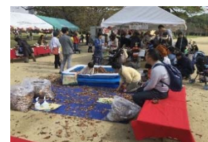
▲秋の公園で遊ぼう