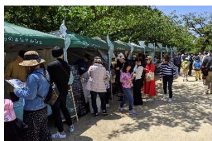
▲みどりのまちマルシェ