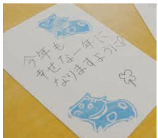
受け取った消しゴムはんこで書いた年賀状