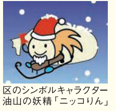
区のシンボルキャラクター 油山の妖精「ニコリん」

〒814-0192 城南区鳥飼六丁目1-1 窓口受付時間：午前8時45分～午後5時15分 (土日・祝休日・年末年始を除く) 区ホームページは「福岡市城南区」で検索