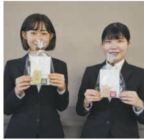
思いを込めて作りました