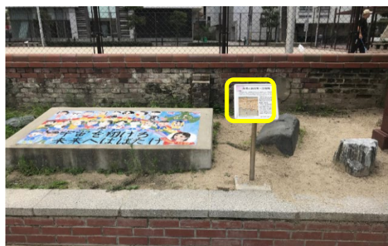
3 か所目 永蔵と紙役所・炭役所

簀子小学校跡地には、令和6年1月末ごろまで 工事のため入れません。 ご了承ください。