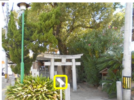
5 か所目 波戸の住吉神社と午砲場跡

来た道に戻り、「港2丁目」交差点をそのまま直進、 「荒戸東」交差点を右へ（西へ）曲がると、大濠公園駅に戻ります。