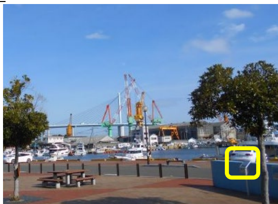
4 か所目 福岡市初の水上飛行場跡