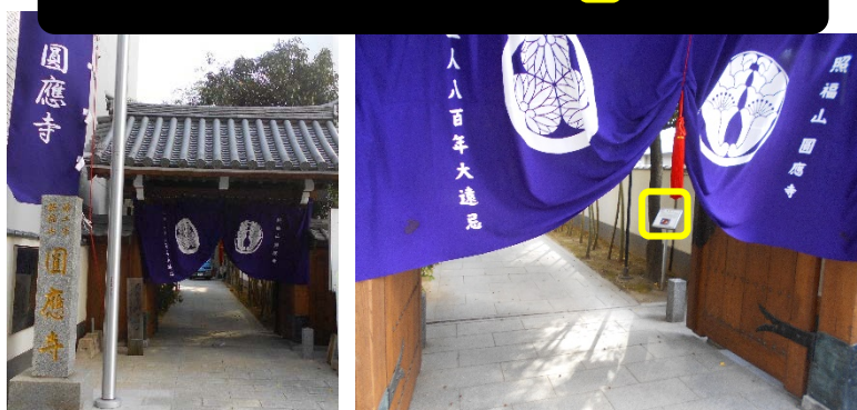
1 か所目 圓應寺

正門を出て左へ(東へ)曲がり,「大手門3丁目」交差点で左へ(北へ)曲がる 次の交差点左手前方,簀子公園内