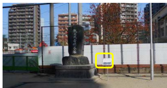
2 か所目 戦災死者供養塔と簀子小赤れんが塀