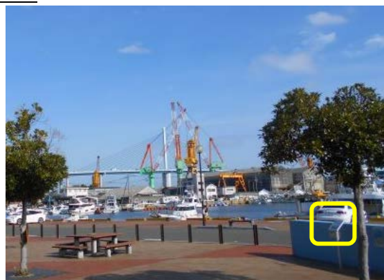
4 か所目 福岡市初の水上飛行場跡