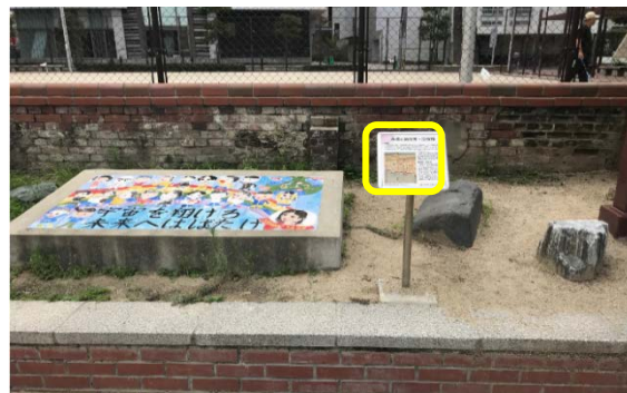
3 か所目 永蔵と紙役所・炭役所

簀子小学校跡を出て左へ（北へ）進み、 「簀子公園入口」交差点で左へ（西へ）曲がる、 「港2丁目」交差点で右へ（北へ）に曲がる。300m程進んだ右手「かもめ広場」内