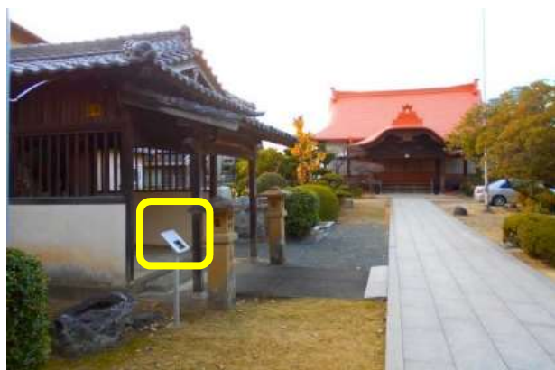
7か所目 八兵衛地蔵の由来

「成道寺」内を進むと進行方向左手側 ☆7か所目 八兵衛地蔵の由来(説明板 1⑨)