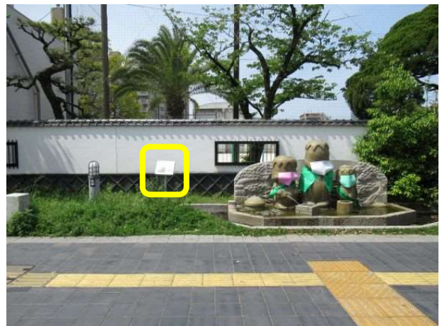
2か所目 せせらぎかっぱ