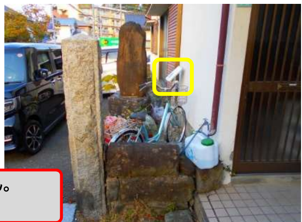
5 か所目 伊勢恵比須神社の跡