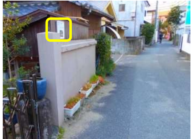
4 か所目 正乗院不動尊