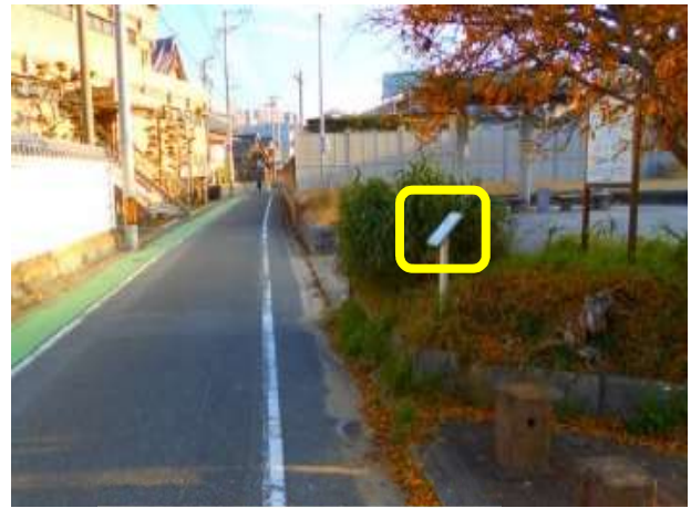
6 か所目 柵小屋跡