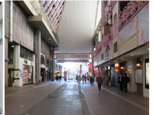
新天町メルヘン広場