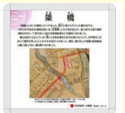
歴史と文化の説明板

このマップは、中央区「歴史と文化の説明板」を巡りながら、気軽にお散歩いただけるマップです。説明板では、中央区にある万葉歌碑、歴史的人物の史跡などを紹介しています。説明板に貼付してある二次元コードをスマートフォンで読み込み、専用サイトへアクセスすることで、内容を音声で読み上げます。(日本語、英語、中国語、韓国語に対応) なお、アプリのダウンロードは不要です。