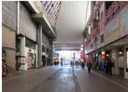
新天町メルヘン広場