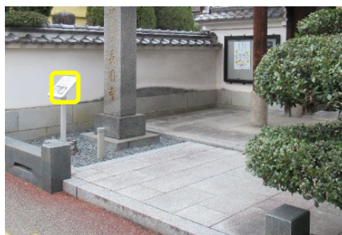
2 か所目 長圓寺

さらに先へ 200mほど進み、大通り(国体道路)に出る 大通りで右に(東へ)曲がり、すぐ1つ目の信号を渡り、 左手の道を 230mほど進む