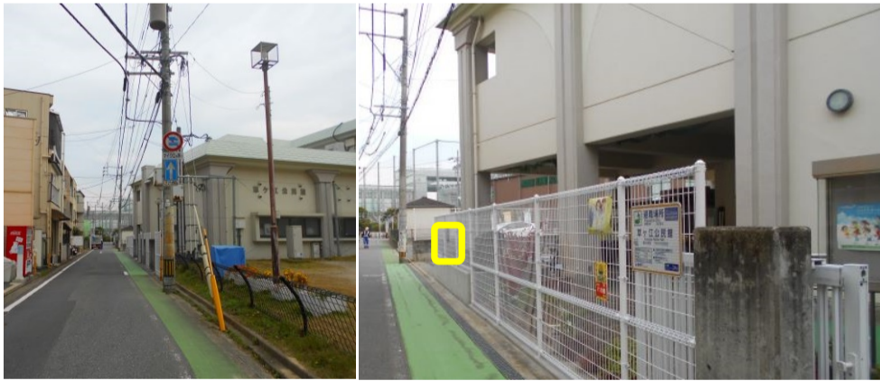
☆2 か所目 草香江の歌碑(説明板 5①)