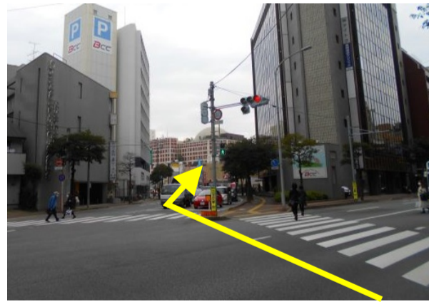
14 一つ目の角「草香江橋東」交差点を左へ(東へ)曲がり、「草香江」交差点で右前方へ進む