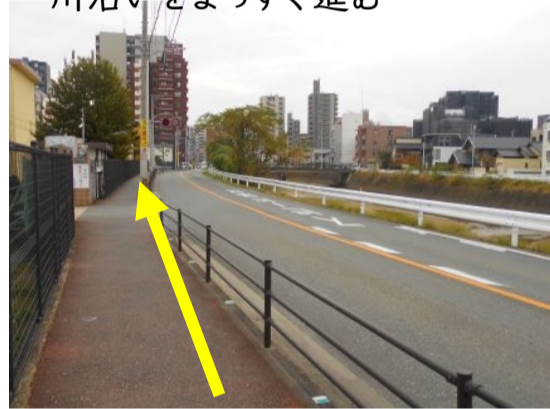
13 樋井川手前交差点を左へ(南へ)曲がり、川沿いをまっすぐ進む