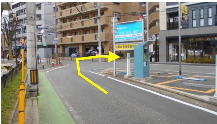
10 来た道を戻り、すぐの角を右に曲がる