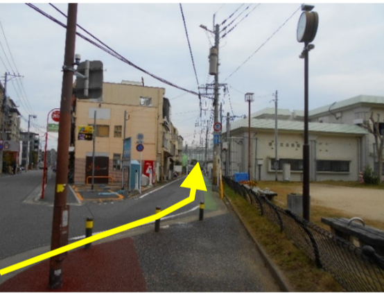
8 曲がってすぐを右前方へ進む