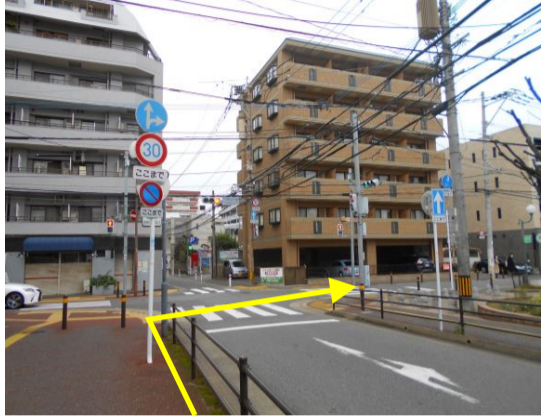
7 400m程進み、「六本松2丁目」交差点を右に曲がる