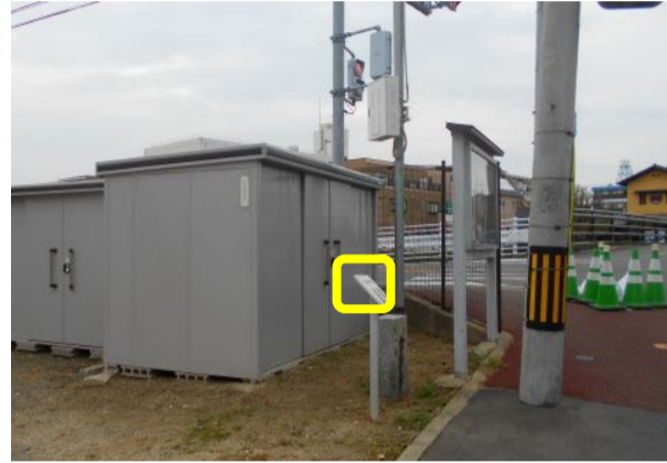
☆3 か所目 草ヶ江支所(出張所)(説明板 5②)