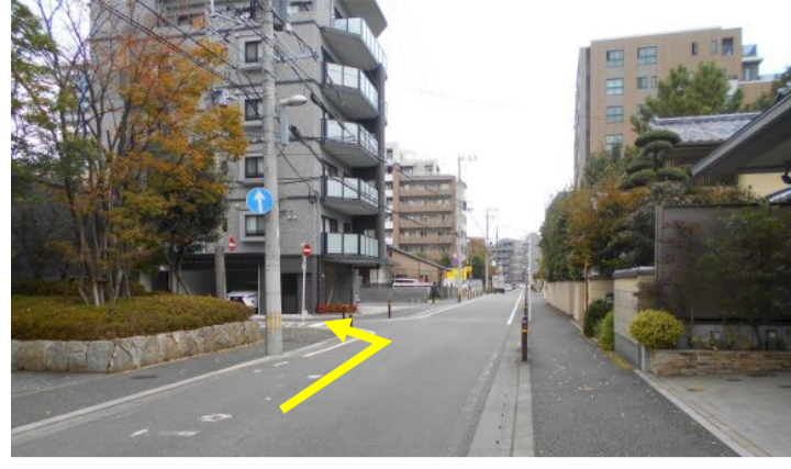
11 次の交差点を左へ(西へ)曲がる