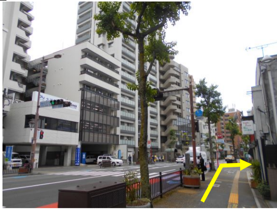
6 次の「県福祉センター入口」交差点で右に曲がる