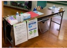
避難所受付のコロナ対策