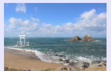
市街化調整区域の 美しい海岸線

地域の魅力発信や情報提供など、市街化調整区域における人口減少や高齢化等の課題に対する地域の取組みを支援します。 【地域支援課 / 企画振興課】