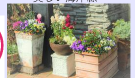
一人一花パートナー花壇