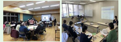
わがまちサミット 里親って？カフェ

身近に支援者がいない子育て家庭等の育児不安解消に向けた取組みを強化します。 ・育児不安を軽減するため、育児相談会を開催 ・発達に気になる子とその保護者のための子育てサロン「のびのび」を開催 ・父親の育児参加推進のための「父親向け講座」を開催【地域保健福祉課】