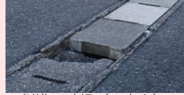
側溝の破損（写真上） 修復後（写真下）

災害時に地域住民による自主防災活動が円滑に行えるよう、防災計画の見直しや防災訓練等を支援します。また、災害時に手助けが必要な人に対して単位自治会ごとの個別避難計画作成を支援します。日本での災害経験が無い外国人居住者に対して、防災知識を習得するための「防災ワークショップ」を開催します。【防災・安全安心室】