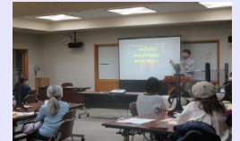
まち・ひとカレッジNISHI

「共創による地域コミュニティ活性化条例」の施行に併せ新たな支援策の情報提供を行うなど、地域活動を支援します。また、地域づくりに関心があり、活動したい人向けの講座「まち・ひとカレッジNISHI」を開催し、地域の担い手づくりを進めます。【地域支援課 / 生涯学習推進課】