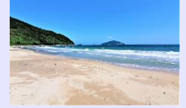
市街化調整区域の 美しい海岸線

市街化調整区域における定住化の促進や魅力発信など、人口減少や高齢化等の課題に対する地域の取組みを支援します。【地域支援課 / 企画振興課】