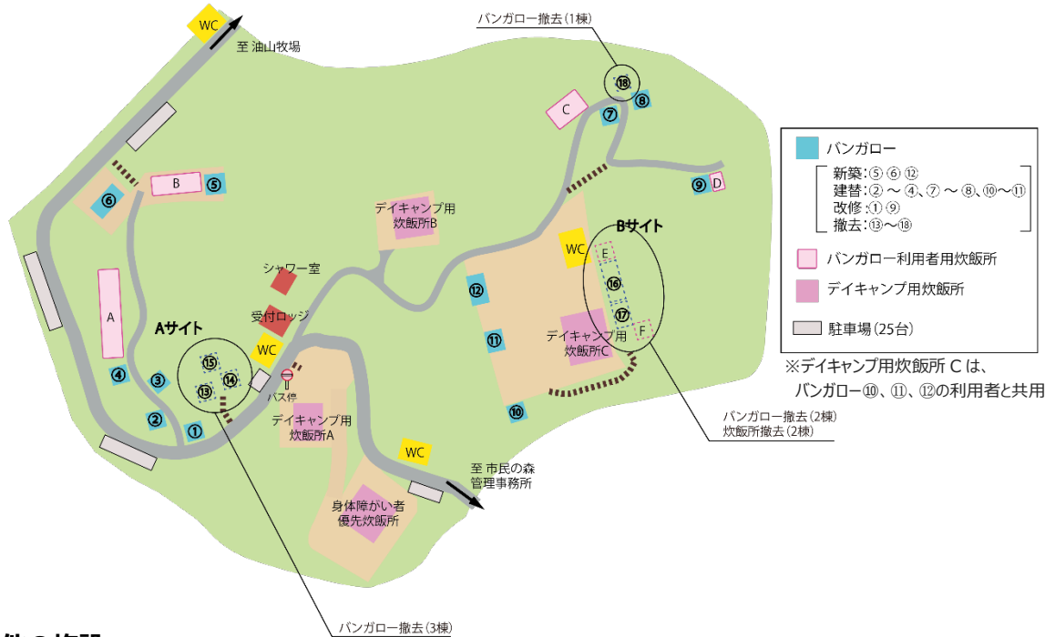
【キャンプ場改修イメージ】