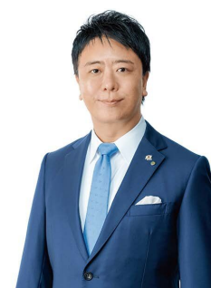
福岡市長 高島 宗一郎

福岡市は、人口が164万人を超え、人口増加数は全国一位、立地した企業の数も過去最高を更新、市が様々な政策を行う財源となる市税収入も同じく過去最高を更新しています。市民の皆さまへのアンケートでは、実に98.2%の方に「福岡市は住みやすい」と回答いただくなど、元気な街、住みやすい街として、国内外から評価されています。