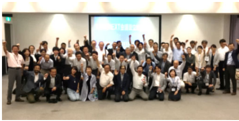
博多湾NEXT会議 (平成30年5月設立)

市民・市民団体・漁業者・学校など多様な主体と連携して、海の環境を良くする海草「アマモ」を増やす活動や博多湾の魅力発信などに取り組んでいます！