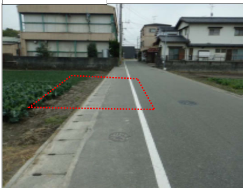
井相田三丁目地区