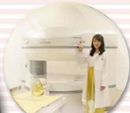
MRI(磁気共鳴画像)装置