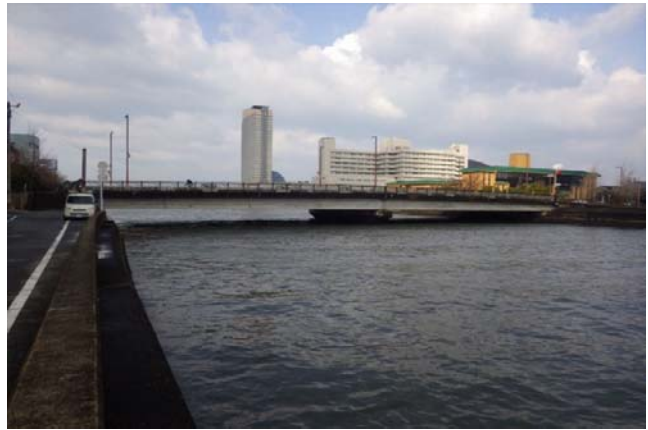
【橋の側面】上流側から撮影

コンクリートが傷んで橋の寿命が縮まる主な原因は、主に水が入ることによります。 橋の表面から雨水が浸透し、コンクリート内に水が侵入し、写真①、②のように部分的な鉄筋の露出や、ひび割れなどが発生しています。 したがって、これらの補修を行うだけでなく、水の侵入を止めるため、舗装をはぎ取って防水処理を行う橋面防水工を施工する必要があります。