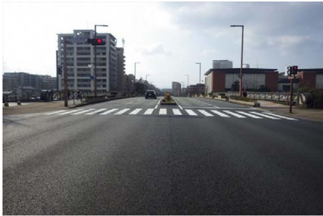
【橋の表面】東側から撮影