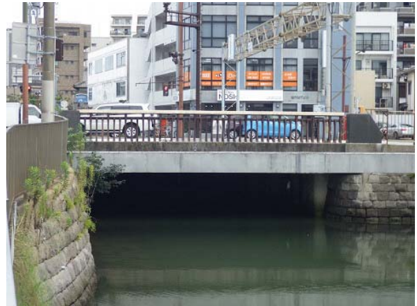
【橋の側面】上流側から撮影

①写真のように老朽化により橋台にひび割れ、遊離石灰が発生しています。遊離石灰とは、漏水により橋面部のコンクリートの成分が溶け出してつらら状に生じる物質です。