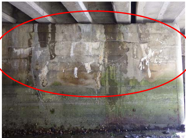
①【橋台のひび割れ、遊離石灰】