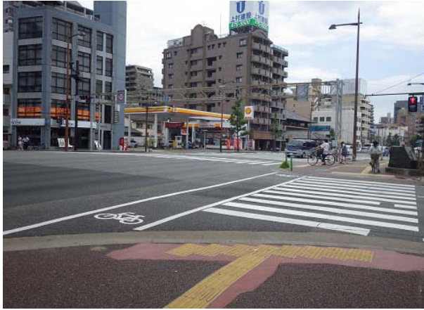
【橋の表面】西側から撮影