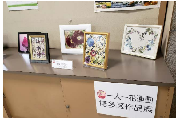
コミュニティ情報コーナー展示スペース展示例