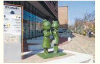
西南学院大学の「町子先生とサザエさん」像(5月27日は「サザエさん通り」と命名された日)

開=日時 所=場所 問=問い合わせ ☎=電話 F=ファクス 対=対象 定=定員 料=料金、費用 持=持参 託=託児 申=申し込み 電=メール 開=開館時間 休=休館日