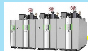
エネルギー消費効率の 高いボイラー