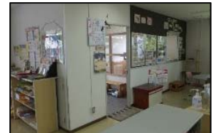
リニューアル前（左：外観、右：飼育室）