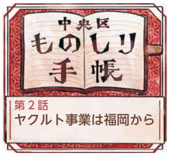
第2話 ヤクルト事業は福岡から

「ヤクルト」を元につくられた言葉です。事業が全国に広がり、昭和30年に本社を東京に移しますが、この地が原点だったことは間違いありません。なぜ唐人町で始めたのかは分かっていますが、永松氏が誘われて創業に関わった人が近くに住んでいたから、という説があるそうです。