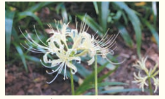
シロバナマンジュシャゲ

区の人口 204,581 人 (前月比 73 人減) (男 91,456 人 女 113,125 人) 世帯数 126,524 世帯 (前月比 84 世帯減) (令和2年8月1日現在推計)