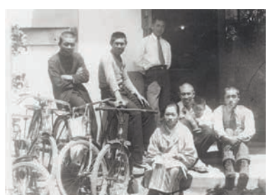
昭和11年頃の代田保護菌研究所