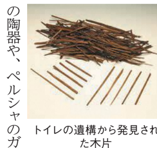
トイレの遺構から発見された木片

○飲酒や大声での会話は控えよう ○少人数で昼の花を觀賞しよう ○火気の使用は控えよう ○マスクを着けて他の人との距離を取り、密を避けて楽しもう ※「福岡城さくらまつり」の記事を本紙4面に掲載しています。