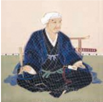
上 福岡城が描かれた「福博惣絵図」 下右 黒田如水肖像画 下左 黒田長政肖像画

福岡城は、同じ舞鶴公園にある鴻臚館と共に、全国でも珍しい国史跡の二重指定を受けています。福岡城の歴史を学んで、出掛けてみませんか。