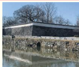
上之橋御門の石垣

区の人口 204,588人 (前月比7人増) (男 91,484人 女 113,104人) 世帯数 126,621世帯 (前月比 97世帯増) (令和2年9月1日現在推計)