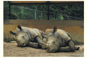
ミナミシロサイ(市動物園)

区人口 204,588人 (前月比7人増) (男 91,484人 女 113,104人) 世帯数 126,621世帯 (前月比97世帯増) (令和2年9月1日現在推計)