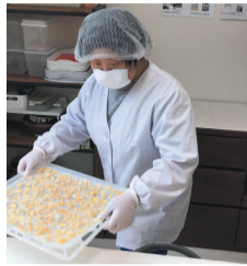
心を込めて商品をつくります

生活介護事業所の「スマップレプラス」(中央区伊崎)は、障がいのある人たちに、食事などの支援や商品づくりなどの機会を提供し、生活に必要な力を向上してもらうための援助を行っています。