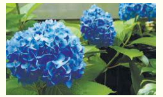
区役所前のアジサイ

区の人口 204,325 人 (前月比 1,287 人増) (男 91,288 人 女 113,037 人) 世帯数 126,309 世帯 (前月比 1,207 世帯増) (令和2年5月1日現在推計)