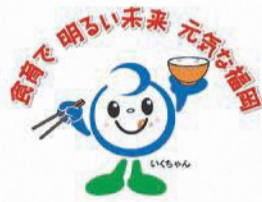
市食育推進キャラクター「いくちゃん」

健康な体は正しい食生活でつくられます。普段の食事の栄養バランスを見直し、正しい食生活を心掛けるなど食育の実践に取り組んでみましょう。 閩区健康課 ☎761-7340 ☎734-1690